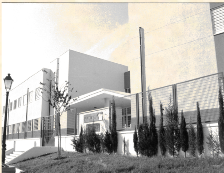
IES La Arboleda

C/ Padre Ellacuría , nº 13 El Puerto de Santa María 11500 Cádiz